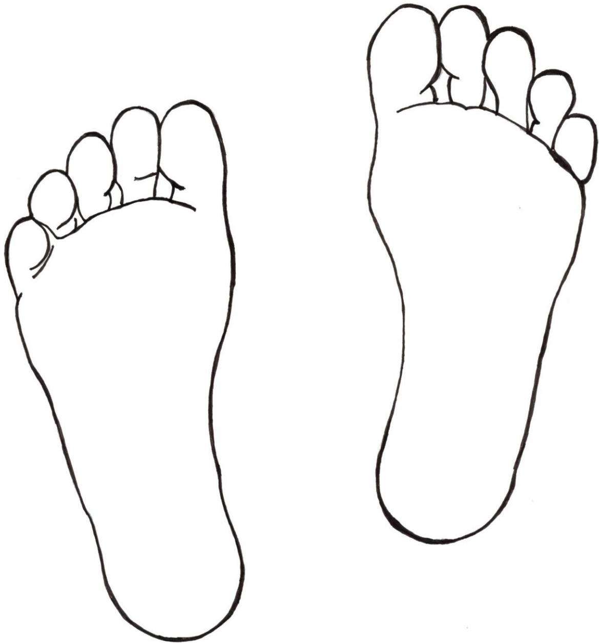
Zeichnung: Brigitte Bucher, Illertalschule Berkheim-Bonlanden