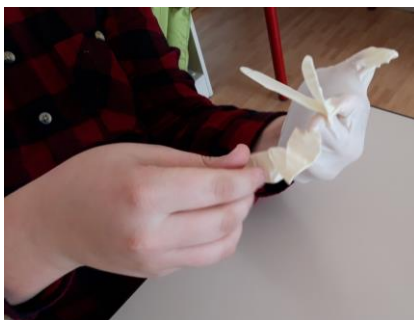
Die Schüler*innen ziehen Einmalhandschuhe an.