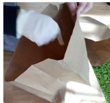
Die Schüler*innen sammeln den Müll in Papiertüten.